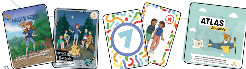
Cahiers Paroles de Boussole